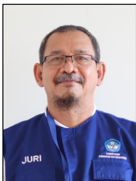
Heru Santoso B.R. PIC KRSBI Beroda