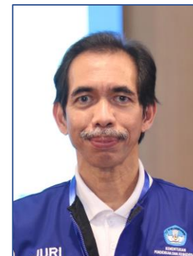
Eril Mozef KRSRI